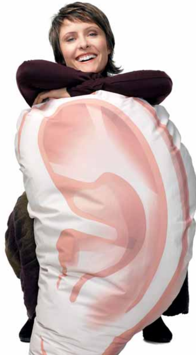
{Loos emol!} eine Kampagne zur Kostbarkeit des Gehörs